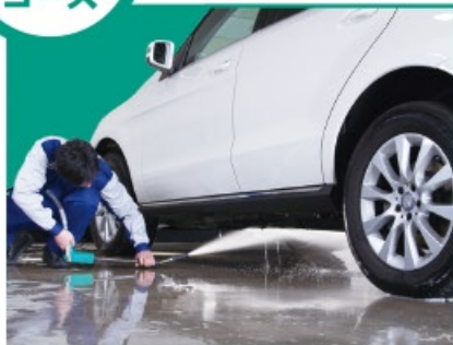
⑦ホイールクリーニング